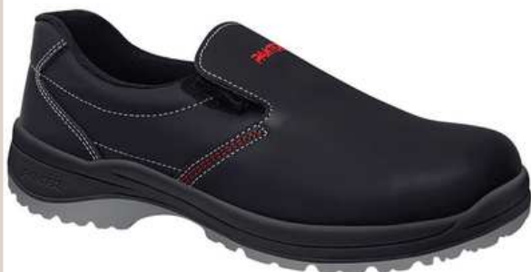
Chaussures basses de sécurité homme à usage des personnels d'entretien