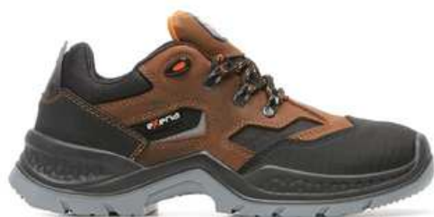
Chaussures basses de sécurité homme à usage des personnels de maintenance