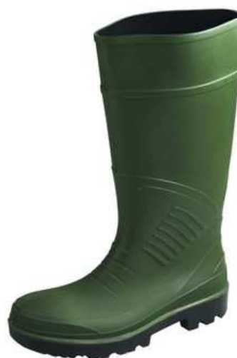
Bottes de sécurité mixtes à usage des personnels de maintenance et des espaces verts

Entretien: lavage manuel avec brosse douce, eau et détergent