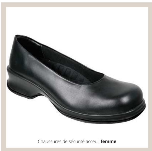
Chaussures de sécurité accueil femme