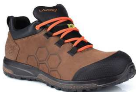
Chaussures basses de sécurité femme à usage des personnels de maintenance