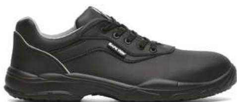
Chaussures basses de sécurité femme à usage des personnels d'entretien