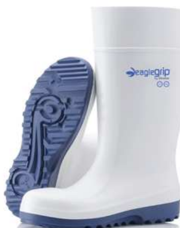
Bottes et demi-bottes de sécurité mixtes à usage des cuisines collectives

Catégorie: S4 SRC Coloris: Blanc Poids: 1320 gr (pour une paire de 39) Pointures: du 36 au 48 Entretien: lavage manuel à la brosse douce avec eau et détergent. Séchage à l'ombre dans un endroit ventilé et sec.