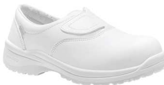
Chaussures basses de sécurité homme à usage des cuisines collectives

séchage naturel hors d'une source de chaleur