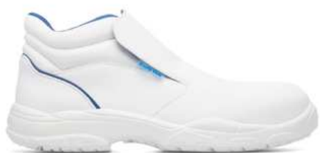
Chaussures hautes de sécurité mixtes à usage des cuisines collectives