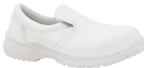
Chaussures basses de sécurité homme à usage des cuisines collectives Chaussures basses de sécurité mixtes à usage des cuisines collectives

Catégorie: S2 SRC Coloris: Blanc Poids: 1050 gr (pour une paire de 42) Pointures: du 35 au 48 Entretien: lavage machine 60°C max. séchage naturel hors source de chaleur