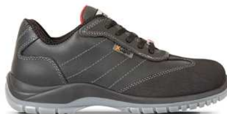
Chaussures basses de sécurité femme à usage des personnels d'entretien

Entretien: Produit d'entretien spécial cuir