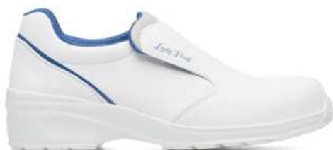
Chaussures basses de sécurité femme à usage des cuisines collectives