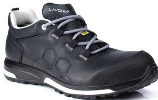
Chaussures basses de sécurité homme à usage des personnels de maintenance

Attention: chausse grand, prendre une pointure en dessous de votre pointure habituelle