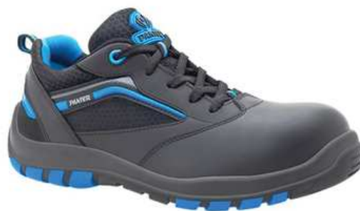
Chaussures basses de sécurité homme à usage des personnels d'entretien