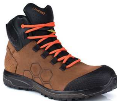
Chaussures hautes de sécurité femme à usage des personnels de maintenance

Attention: chausse grand, prendre une pointure en dessous de votre pointure habituelle.