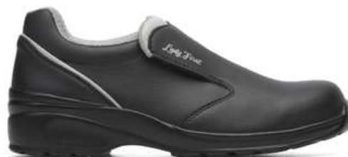
Chaussures basses de sécurité femme à usage des personnels d'entretien

Entretien: lavage machine à 40° max. séchage naturel hors d'une source de chaleur