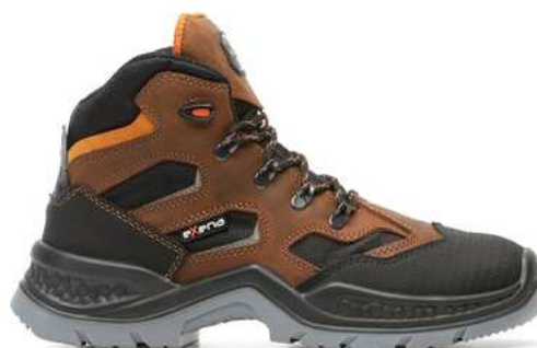
Chaussures hautes de sécurité homme à usage des personnels de maintenance

Entretien: produit pour l'entretien du cuir