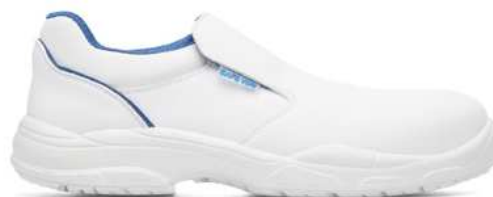
Chaussures basses de sécurité femme à usage des cuisines collectives

séchage naturel hors d'une source de chaleur