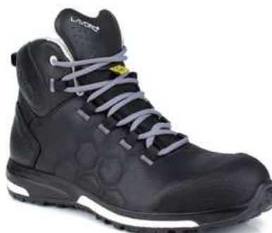
Chaussures hautes de sécurité homme à usage des personnels de maintenance

Attention: chausse grand, prendre une pointure en dessous de votre pointure habituelle.