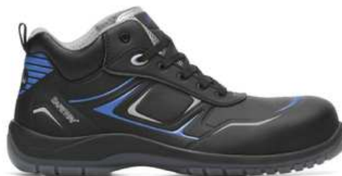
Chaussures basses de sécurité homme à usage des personnels d'entretien

séchage naturel hors d'une source de chaleur