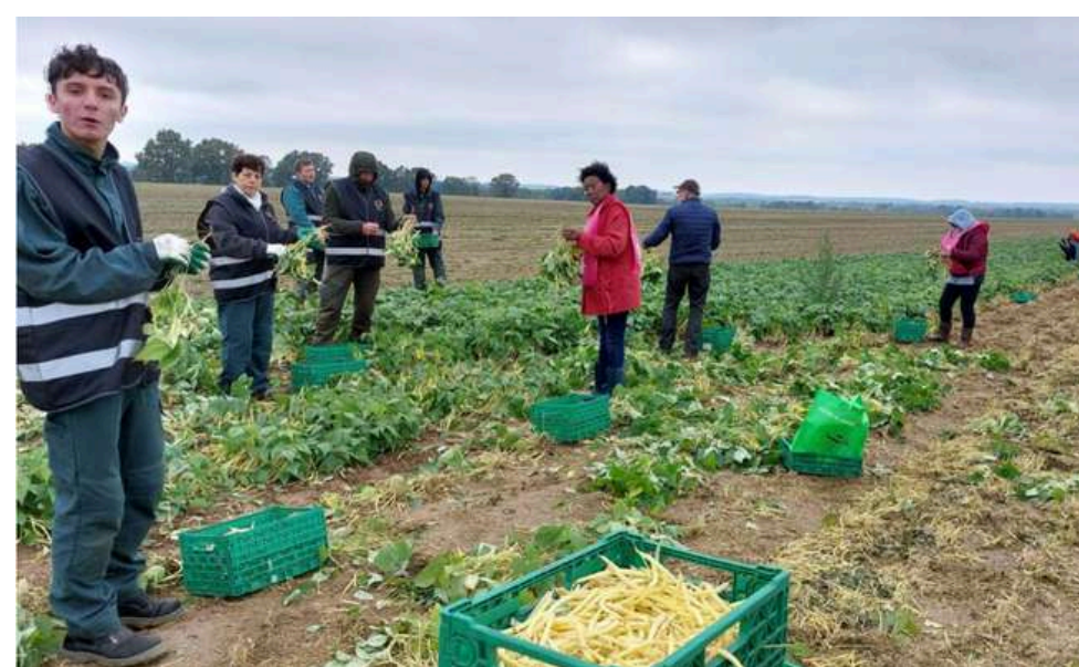
Photo extrait de l'article le Parisien « Ça évite qu'ils soient perdus » : des lycéens du Val-d'Oise récoltent des haricots pour l'aide alimentaire".

Le jeudi 3 octobre , un deuxième glanage solidaire a été organisé à Gouzangrez dans le Val-d'Oise par des élèves du lycée professionnel La Tour du Mail de Sannois (95) chez un agriculteur. Les 7 lycéens présents se sont activés lors de cette matinée pour glaner des haricots ensuite donnés à deux associations d'aide alimentaire présentes sur place : les Restos du cœur du Val d'Oise et l'Entraide Protestante d'Enghien .