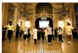
@ Lycée M Laurencin

Créer une friperie au sein du lycée permet d'impliquer les élèves et de changer les usages. Les vêtements trouvent ainsi une seconde vie et les élèves développent des compétences.