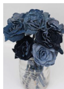
Illustration de Upcycling : Roses à partir de jeans