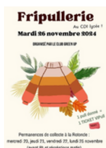
@ Lycée Camille Sée

Le lycée Marie Laurencin (75) a organisé une "Collecte en mouvement" de vêtements de sport à destination des femmes et filles en réinsertion ou en difficulté.