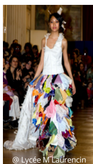
@ Lycée M Laurencin

9 lycées ont participé l'an passé, au défi de collecte solidaire, avec des ateliers créatifs hebdomadaires (customisation, journée seconde main, organisation d'une troc party, expositions et sensibilisations, défis collectifs et individuels,...).