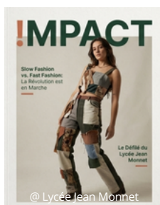
@ Lycée Jean Monnet