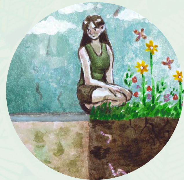
Illustration par Jeanne Grégoire

Quelles sont les solutions pour préserver les sols et l'eau ?