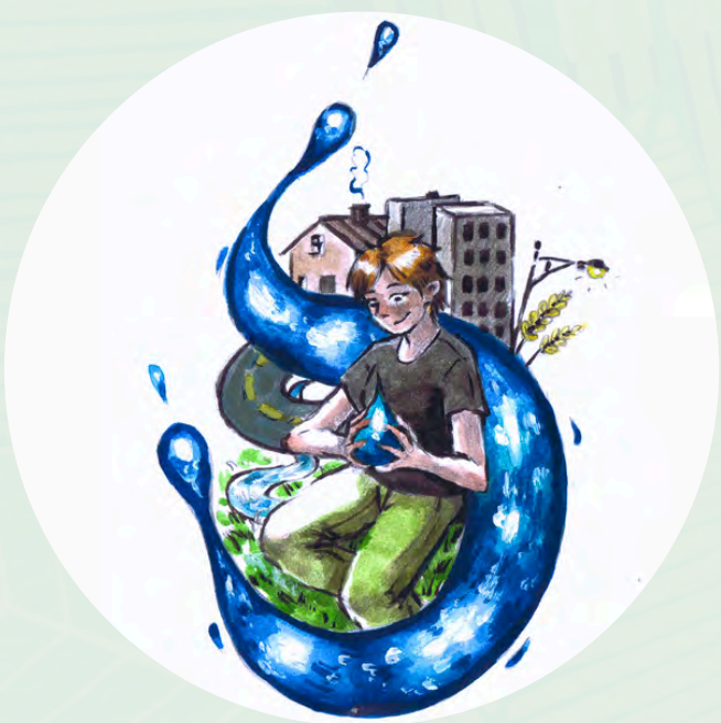
Illustration par Jeanne Grégoire

Sous la forme d'une fresque , l'association Espaces a présenté les enjeux liés à la trame bleue en milieu urbain. Les continuités écologiques sont aujourd'hui fortement altérées par les activités humaines et par le changement climatique .