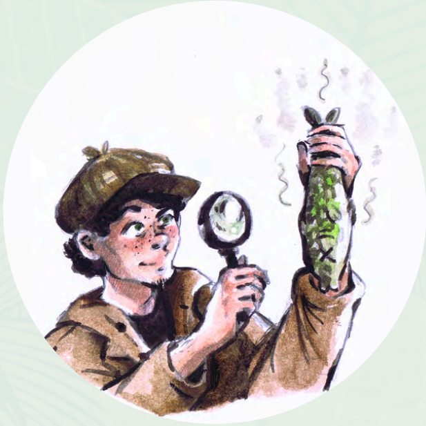
Illustration par Jeanne Grégoire

L'association Au fil de l'eau a animé un jeu de détective visant à découvrir les pollutions aquatiques et retrouver la cause d'un accident.