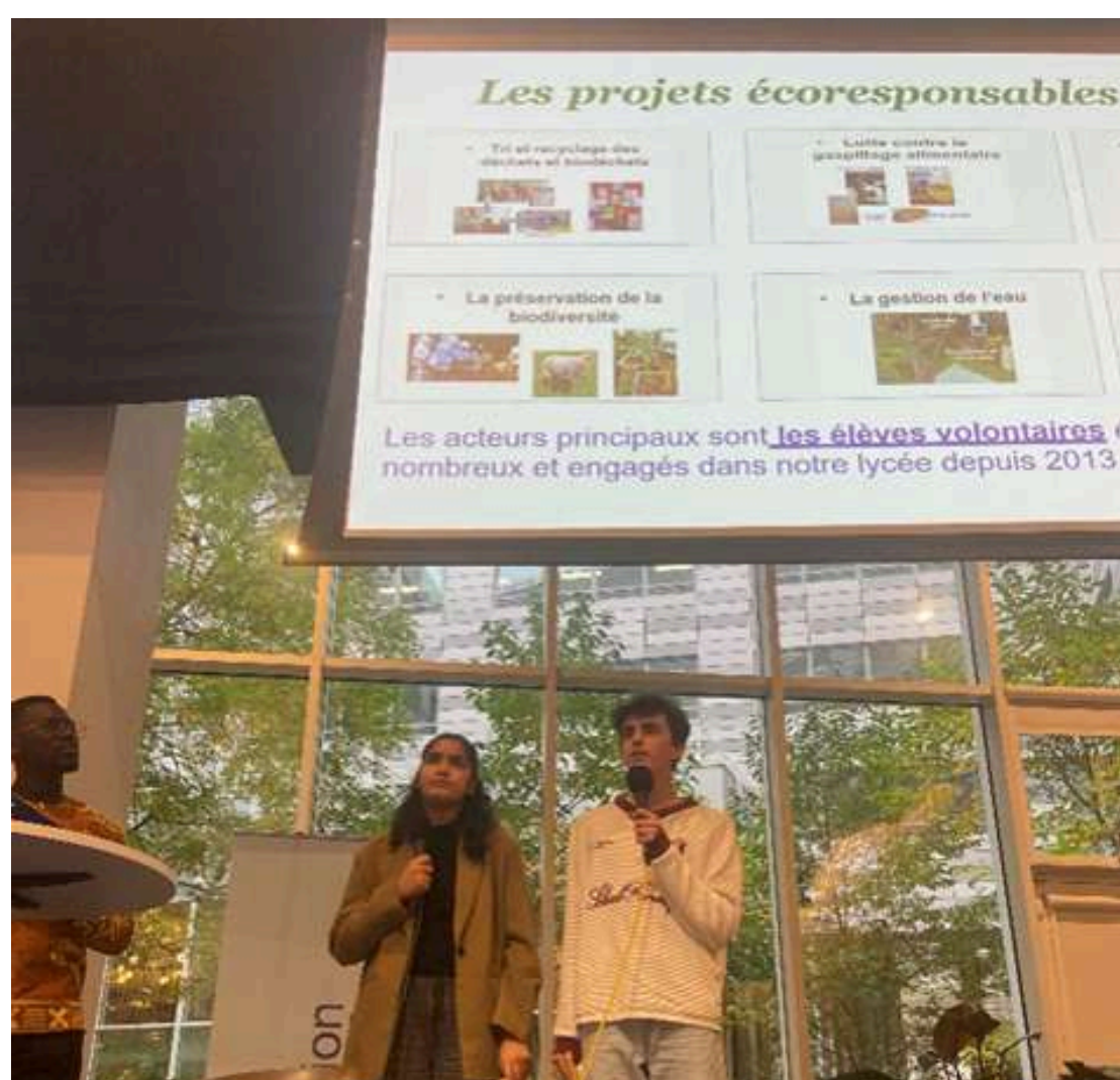
Photographies de la région Île-de-France