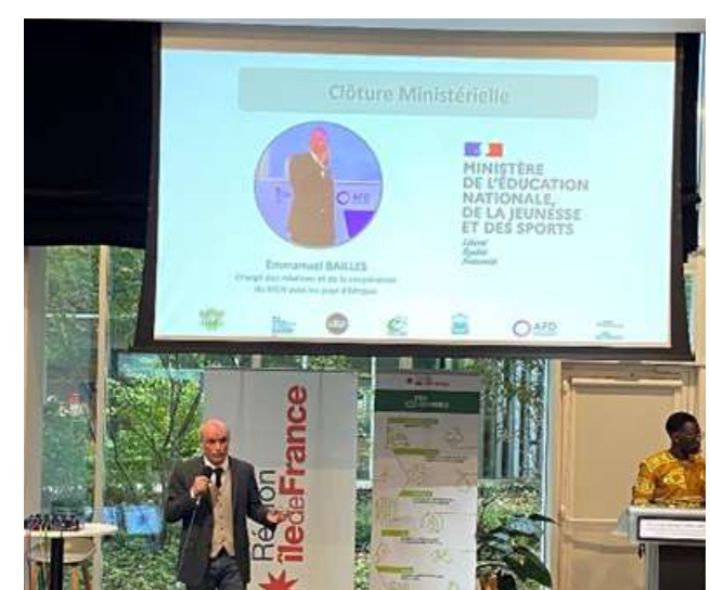
Photographies de la région Île-de-France

Avec les prochaines étapes – ateliers de sensibilisation à l'économie circulaire des Valoristes, création de podcasts avec Making Waves et partenariats scolaires entre lycées franciliens et abidjanais – cette édition promet d'être riche en créativité et partage interculturel autour de l'économie circulaire.