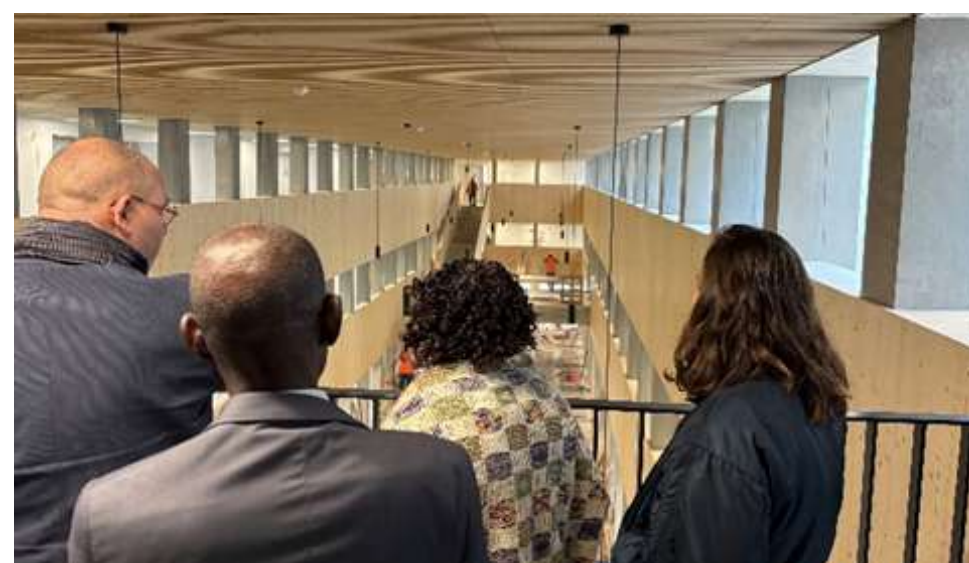
Photographies de la région Île-de-France

Suite à cette semaine, la délégation a fait état de son séjour en Île-de-France lors de la levée solennelle du drapeau le lundi matin dans les différents lycées Abidjanais.