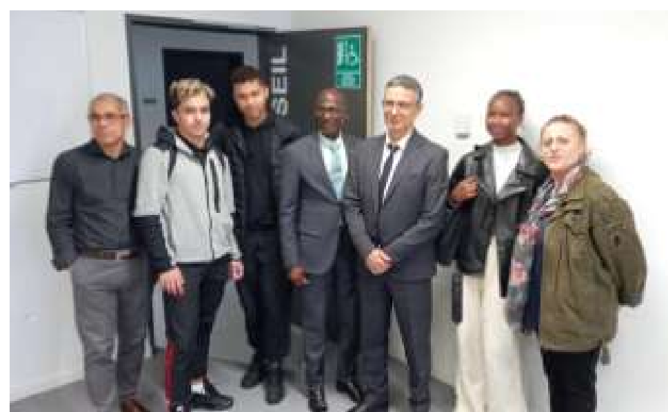
Photographies de la région Île-de-France

Le pôle Lycées, par la démarche des Lycées Éco-Responsables de la région Île-de-France, a organisé vendredi, une visite enrichissante du lycée Evariste Galois à Sartrouville (78). Ce lycée est actuellement en rénovation et les travaux entrepris mettent l'accent sur l'environnement et l'économie circulaire. Cette visite a ainsi permis d'offrir aux proviseurs ivoiriens un aperçu concret des objectifs environnementaux de la Région dans ses opérations de construction/ réhabilitation/ rénovation . L'ensemble du projet s'inscrit dans une démarche alliant efficacité énergétique, utilisation de matériaux durables et réemploi.